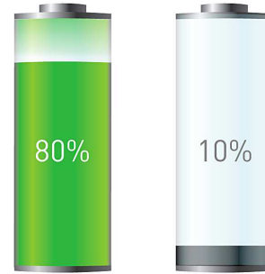
Nabíjecí baterie PANASONIC Běžné nabíjecí baterie