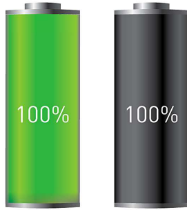
Nabíjecí baterie PANASONIC Běžné nabíjecí baterie